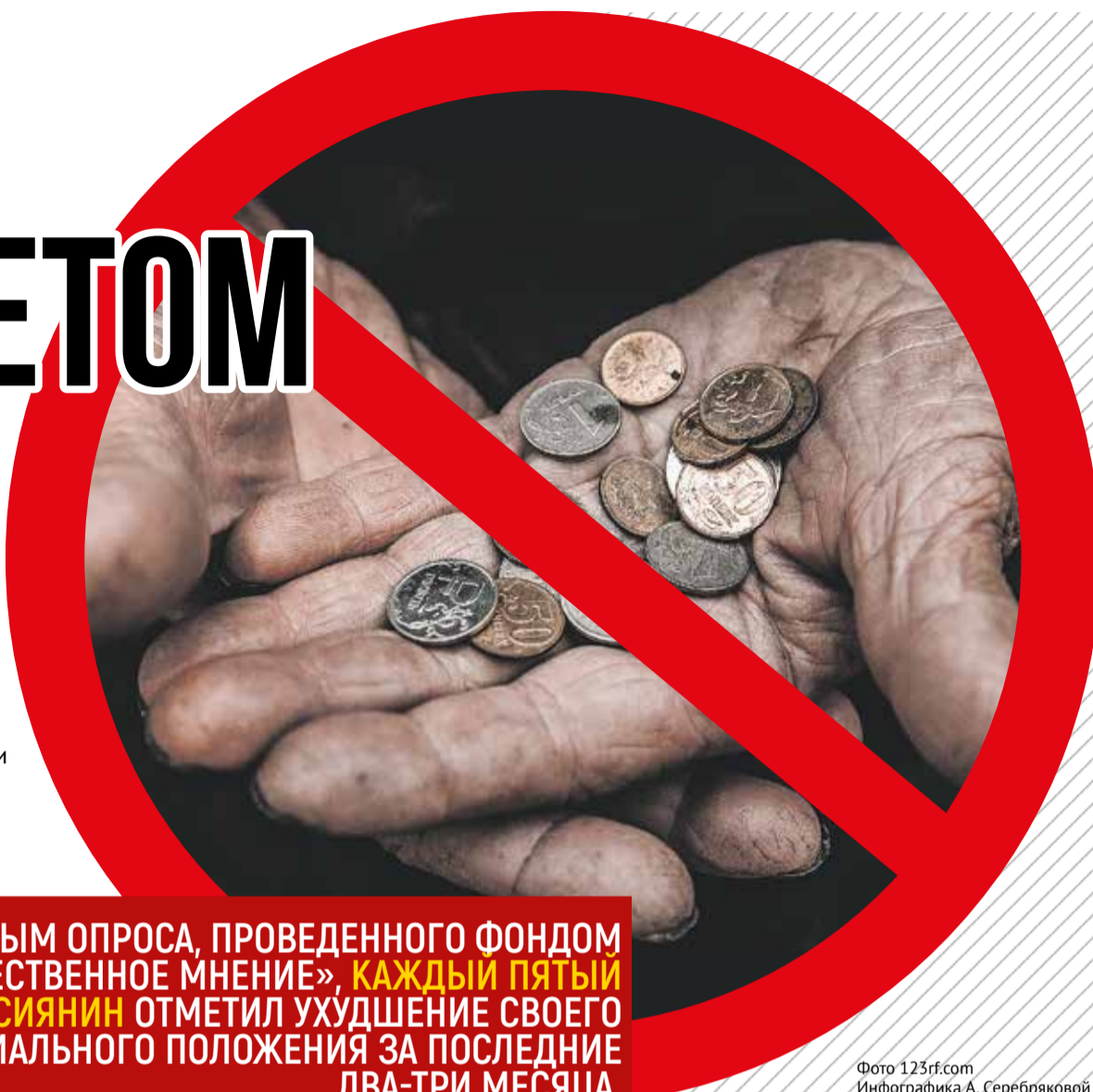
Фото 123rf.com Инфографика А. Серебряковой

43,6 ТЫСЯЧИ РУБЛЕЙ – СТОЛЬКО СОСТАВЛЯЕТ РЕАЛЬНЫЙ ПРОЖИТОЧНЫЙ МИНИМУМ, РАССЧИТАННЫЙ ЭКСПЕРТАМИ ПАРТИИ СПРАВЕДЛИВАЯ РОССИЯ – ЗА ПРАВДУ НА ОСНОВЕ СТОИМОСТИ ПОТРЕБИТЕЛЬСКОЙ КОРЗИНЫ ПО ЦЕНАМ НА КОНЕЦ 2023 ГОДА.